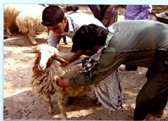
نشانی: شهرک امیریه - اداره کل دامپزشکی استان اصفهان

نظر به اهمیت مایه کوبی عمومی در کنترل بیماری آبله و این که جلوگیری از نقل و انتقالات دامها هنوز امری خارج از دسترسی است ایجاد پوشش ایمنی بالای ۸۰ درصد جمعیت دامی در کشور به عنوان استراتژی برنامه مبارزه قرار دارد و در جهت تحقق و دستیابی به آن انجام واکسیناسیون همزمان آبله و شارین در گوسفند و بز همچون گذشته، امری مجاز اعلام می گردد، تا بتوان در تعداد رفت و آمد به دامداریها و هزینه های آن و نیز در زمان انجام مایه کوبی صرفه جویی و تسریع به عمل آید.