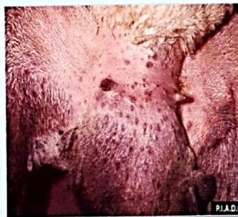
ضایعات جلدی در بیماری آبله